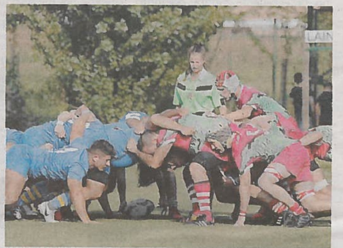
Una mischia tra i giocatori di Lainate e Gossolengo nel corso dell'amichevole